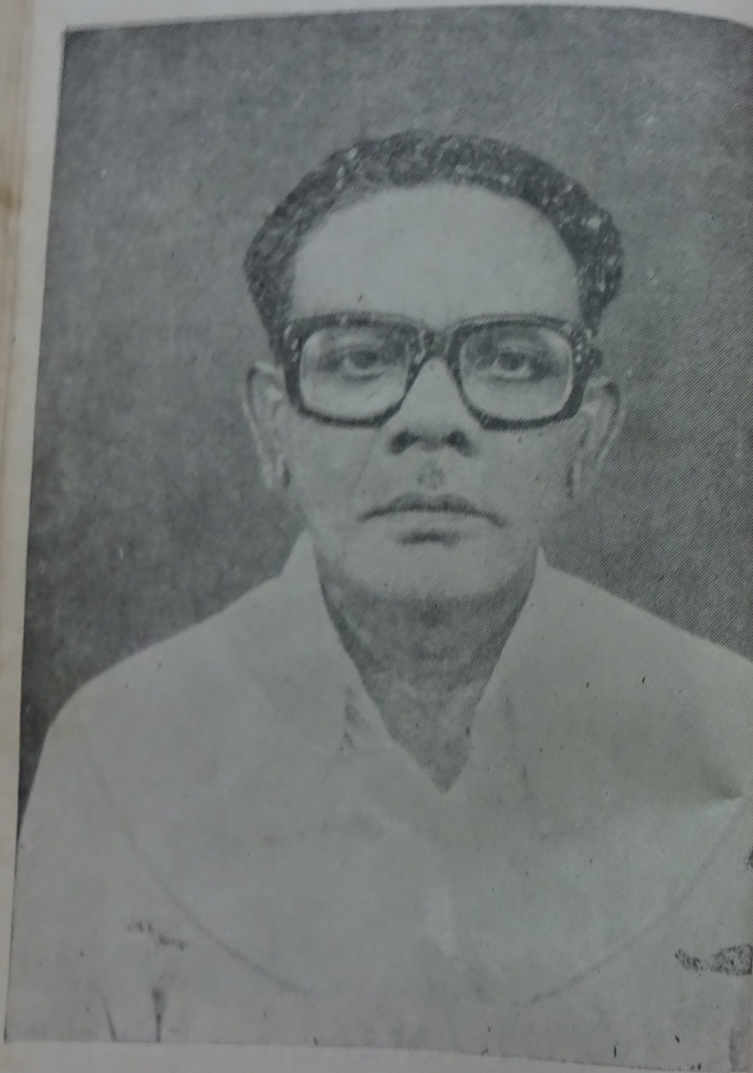
కృత్రిక శ్రీ రామూరి ఏకాంబరం