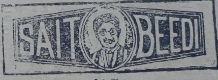
రిజిస్టరు క్రేడ్ మార్కు