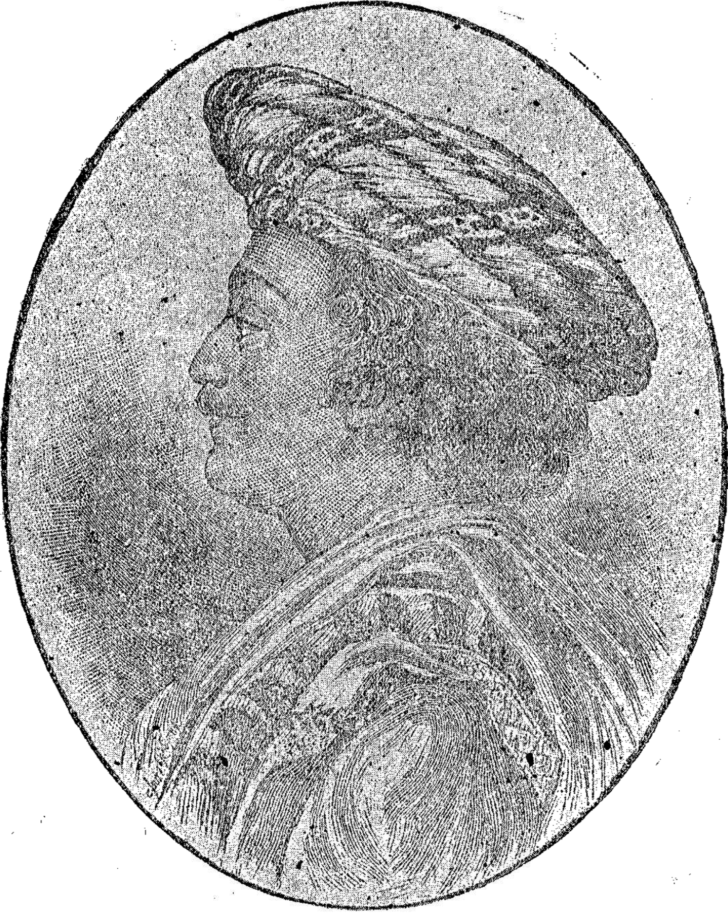
RAJAH RAM MOHAN ROY.