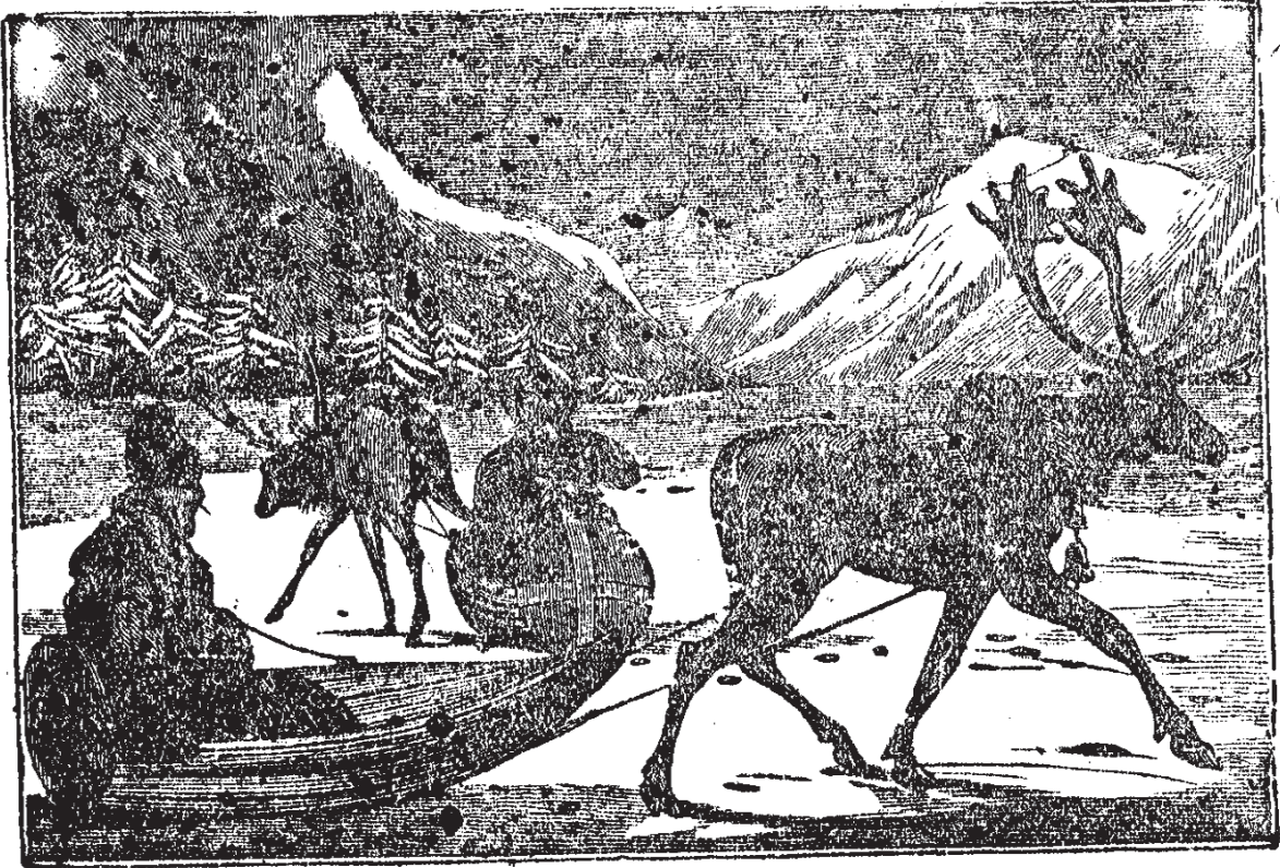
ఈబండ్లనట్లే రపు టమరికా మొదలయిన దేశములలో మక్కలను గట్టుటయు గలదు. కొన్ని సమయములయందు మేఘములనుండి నడగండ్లును సగము కరగిన మంచుగడ్డను పడును.

సమయములయందు భూతల సమీపమునందు సహితము వాయు వత్సంత శీతలముగా నుండెడి యిట్లునుంటి దేశములలో పేరినమందు భూమిపైనిగురిసి నూర్యరశ్మివలన మగల కరగనలనును తెల్లని యాఛాదనమువలె భూమి నలంకరించుచుండును. ఇట్లు మరసిడిమంచుయొక్క పరిమితి దేశముయొక్క శీతలస్థితి ననుసరించి హెచ్చుతగ్గులుగా నుండును. క్రొత్తగా విడిచివేయుచున్నప్పుడు లోతును చేతికట్టితో గ్రుచ్చి కొలువవచ్చును. ఒక్క మునుగులో లోతును చొక్కయంగుళమువర్షముతో సమానమగును. ఈ పేరినమందు భూమిని దాని నిలవయుండిన సమయమున క్రమక్రమముగా గట్టిపడి గడ్డకట్టిపోవును. రషీనూ నొకరైన శీతలదేశములయందు సంవత్సరములో బహుమానములవలన మంచు భూమిపైనిని లిచియుండుట చేత సంచారము చేయవలసినవచ్చినప్పుడు గట్టిబనులు కాళ్లు మంచులో దిగబడిపోవుచుండుటగా విశాలములైన తేలిక చెప్పులు తోడుగుకొనియొనను ననుచు; లేదా యొక రీతిజారునుబండ్లలో నెనను పోవుదురు. ఈబండ్లనీడ్చుట కట్టిశీతల దేశములలో వెట్ట పదేశములయందు గుట్టములను గట్టుదురుగాని చెలువుపదేశములలో రెయినడి రనబడి యొకజాతి దుప్పులను గట్టుదురు. దుప్పులీడ్చెడి బండియొక్క రూపమిక్రింది పటమున జూపబడియున్నది.